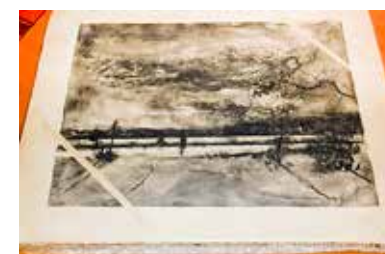
Une des 3600 pierres lithographiques utilisée par l'artiste