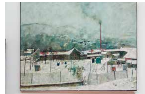
Paysage de neige

à contre-courant les visiteurs et leur proposer des œuvres de GANTNER qui sortaient des thèmes de prédilection de l'artiste. Ainsi, en