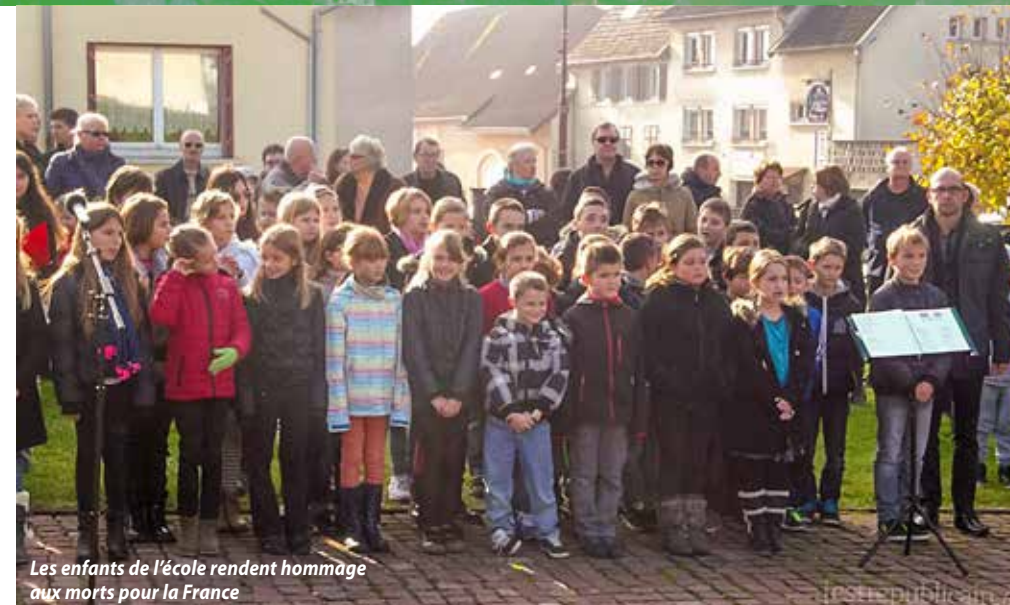
Les enfants de l'école rendent hommage aux morts pour la France