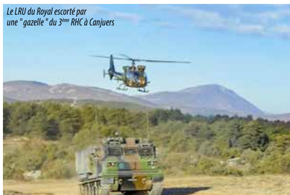
Le LRU du Royal escorté par une "gazelle" du 3 ème RHC à Canjuers

Texte et photos : Cellule Communication 1 er RA