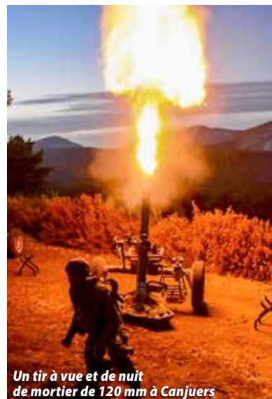
Un tir à vue et de nuit de mortier de 120 mm à Canjuers