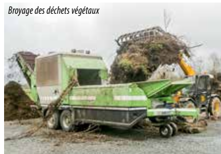
Broyage des déchets végétaux

Le compost est un engrais naturel utilisé en agriculture et en jardinage. Il fournit progressivement les nutriments nécessaires à la croissance des végétaux. Il renforce les résistances naturelles des plantes contre les parasites et les variations climatiques. Enfin le compost facilite le travail du sol et réduit les arrosages.