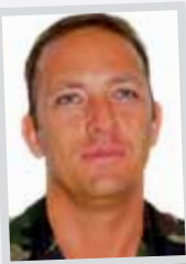
Capitaine Le Hecho Commandant d'unité 6 ème batterie / CoBRA

Vient de prendre le commandement de la 3 ème batterie du régiment les « Gryffons » du Royal.