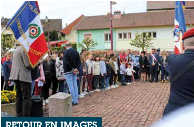
RETOUR EN IMAGES