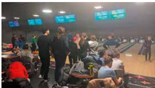
Néolaser et Bowling – Starbowl Audincourt

Mini séjour à la Base Nautique du Malsaucy - 2 jours et 1 nuitée